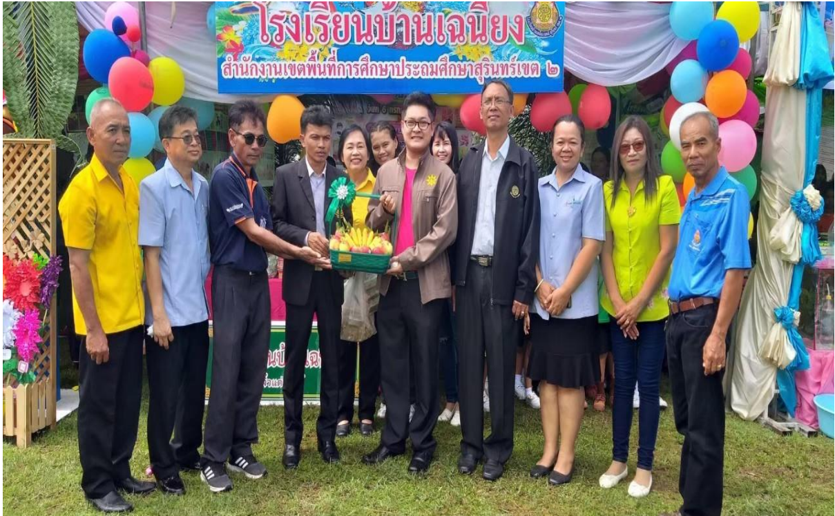
กิจกรรมโครงการศูนย์ความปลอดภัยทางถนนอำเภอท่าตูม ปีใหม่๖3 ร่วมกับวิทยาลัยการอาชีพท่าตูม