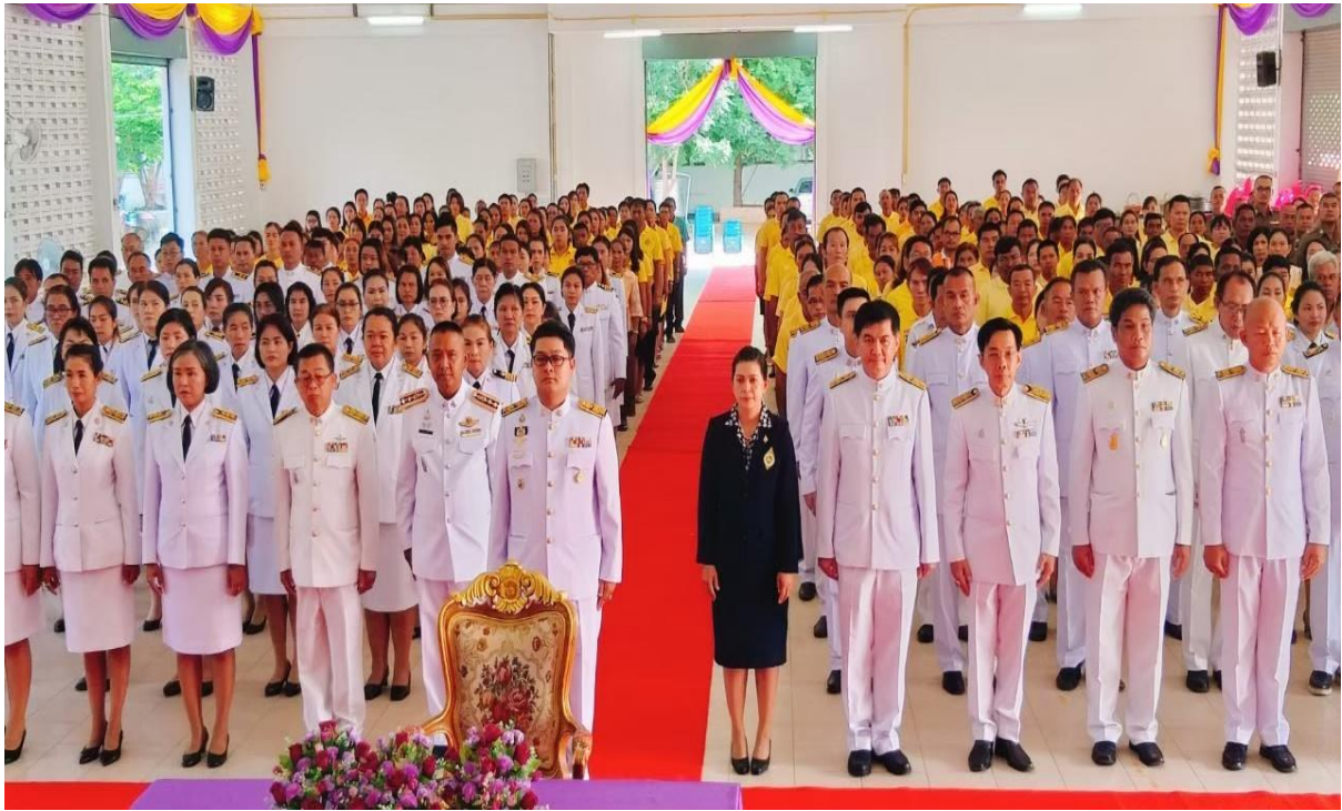
หน่วยแพทย์อาสาสมเด็จพระศรีนครินทราบรมราชชนนี (พอ.สว.)