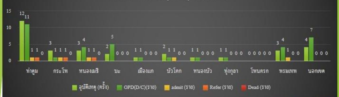
กราฟแสดงการเกิดอุบัติเหตุแยกรายตำบล

สรุปรายงานการเกิดอุบัติเหตุทางถนนช่วงเทศกาลปีใหม่ 2563 อำเภอท่าตูม ระหว่างวันที่ 27 ธันวาคม 2562 ถึง 2 มกราคม 2563 เกิดอุบัติเหตุ 32 ครั้ง บาดเจ็บ 44 ราย ไม่มีผู้เสียชีวิต พาหนะที่เกิดอุบัติเหตุมากที่สุดคือ รถจักรยานยนต์ บาดเจ็บ 42 ราย Refer รพ.สุรินทร์ 3 ราย พฤติกรรมเสี่ยงคือ ดื่มเครื่องดื่มแอลกอฮอล์ จำนวน 20 ราย ไม่สวมหมวกนิรภัย 35 ราย ตำบลที่เกิดเหตุมากที่สุด คือ ตำบลท่าตูม จำนวน 12 ครั้ง บาดเจ็บ 13 ราย ตำบลที่ไม่มีอุบัติเหตุคือ ตำบลโพนครก ตำบลที่เกิดอุบัติเหตุรุนแรงที่ต้องส่งต่อผู้บาดเจ็บ คือ ตำบลท่าตูม ตำบลกระจ่าง ตำบลหนองเมธี Refer ตำบลละ 1 ราย