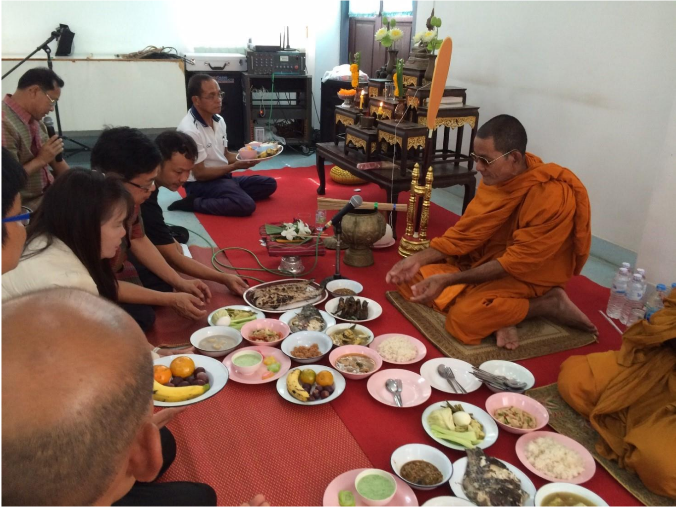
การสร้างวัฒนธรรมทำบุญปีใหม่ วันที่ ๒ มกราคม ๒๕๖๒